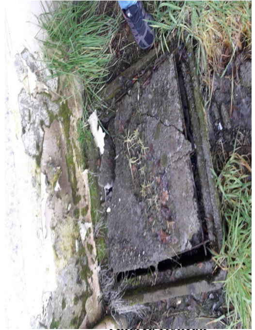
Del. Salud en la Escuela Zona Andina – UnTER